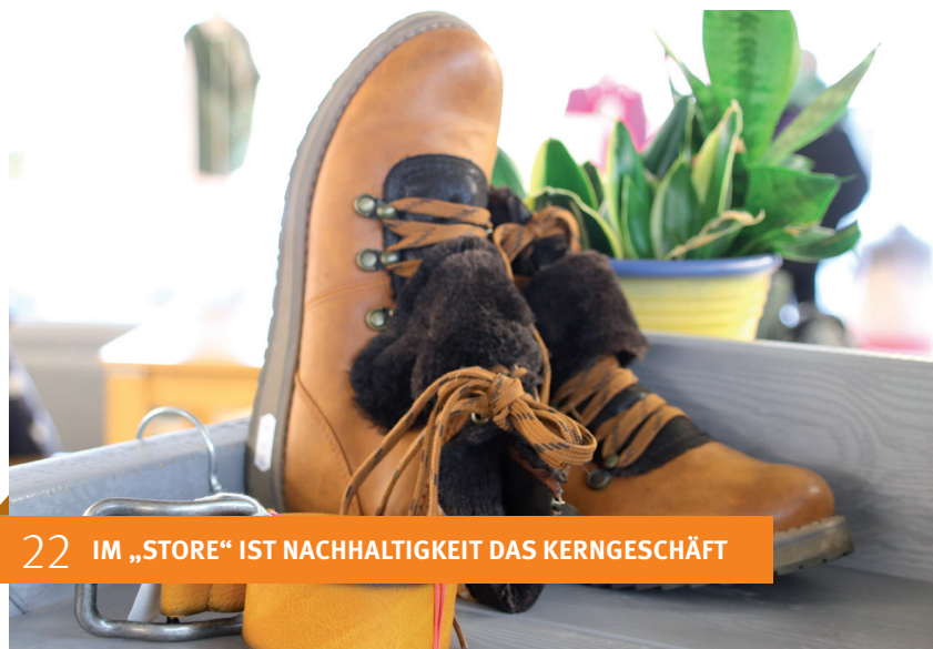
22 IM „STORE“ IST NACHHALTIGKEIT DAS KERNGESCHÄFT