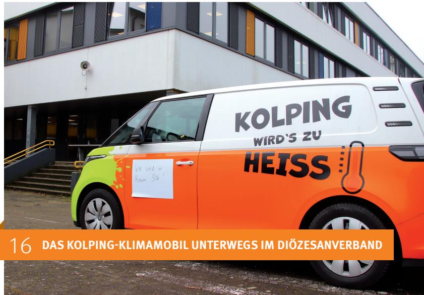
16 DAS KOLPING-KLIMAMOBIL UNTERWEGS IM DIÖZESANVERBAND