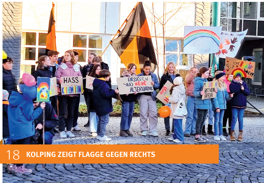
18 KOLPING ZEIGT FLAGGE GEGEN RECHTS